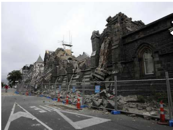
Das verheerende Erdbeben 23.2.2011 in Neuseeland (Christchurch)

Wenn wir die vergangenen Monate anschauen stellen wir fest, die Welt spielt verrückt. Umsturz in Tunesien und Ägypten, Proteste in Jemen, Bachrain, Syrien die meisten mit sehr schlimmen Folgen für die Zivilbevölkerung. Dann Krieg von Gaddafi gegen sein eigenes Volk, Anschlag in Marokko. Die Naturkatastrophen: Die Überschwemmungen in Australien, danach Hurrikans in Queensland und jetzt aktuell in Amerika und nicht zu vergessen die schlimmsten apokalyptischen Träume die uns heimsuchen